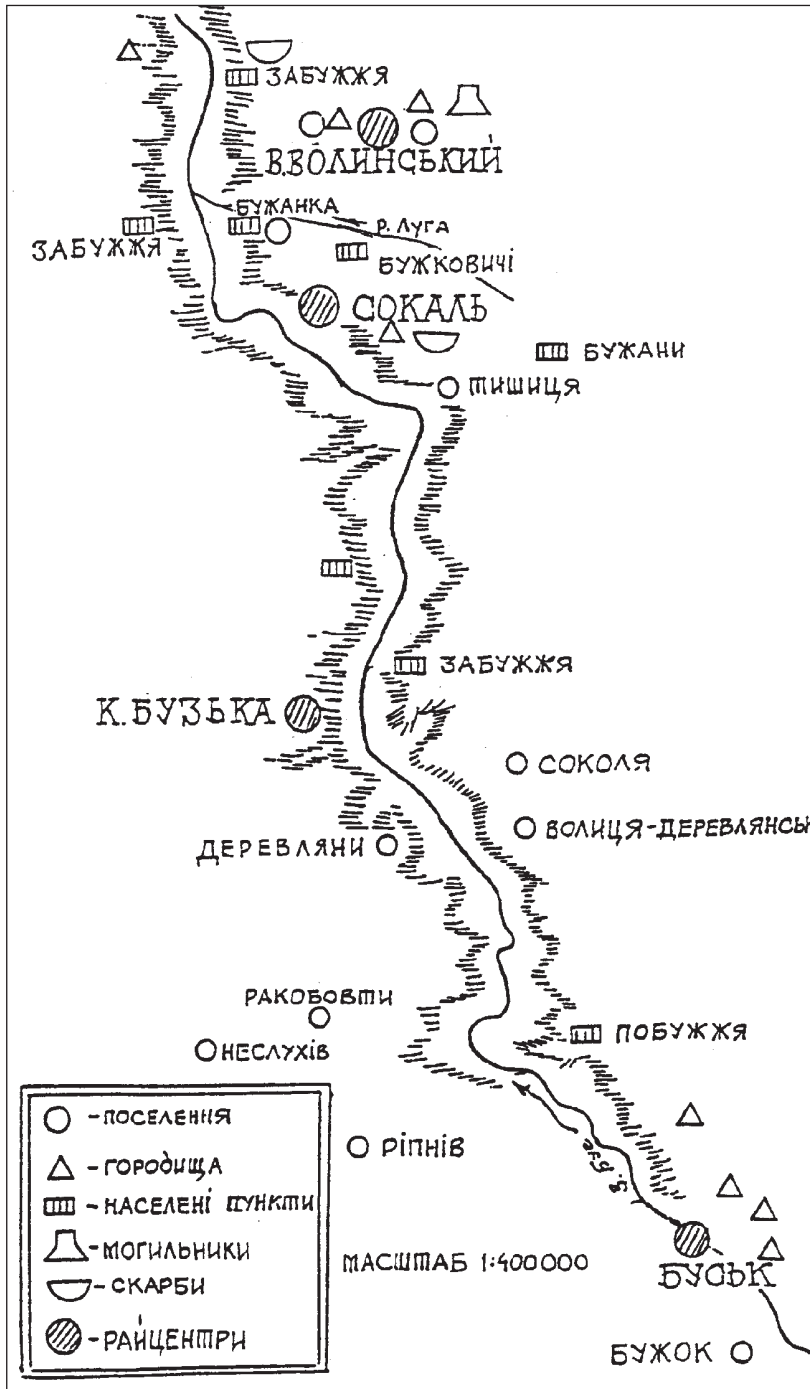
Рис. 1. Карта населених пунктів з назвою "Бужани" (за Р. Чайкою)