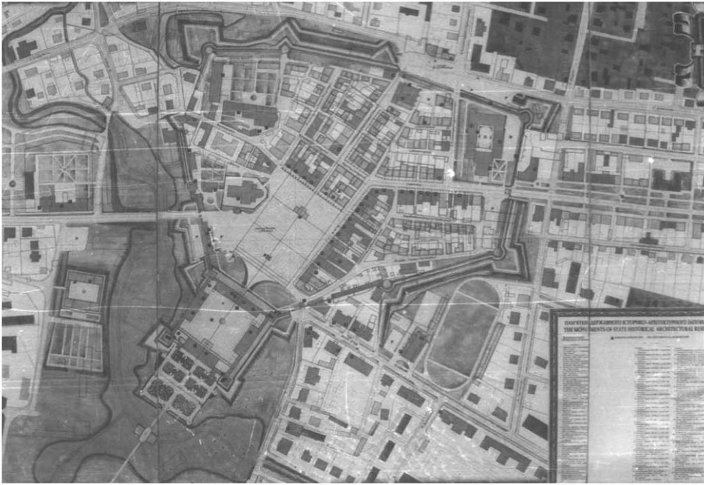
Рис. 2. Кадастровий план м. Жовкви. Середина XIX ст.