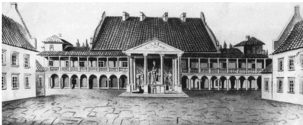
Рис. 4. Вигляд корпусу палацового замку. Малюнок. Кінець XVIII ст.