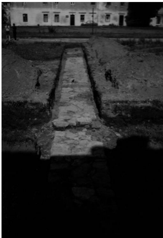
Рис. 5. Кам'яний вистил у центральній частині замку, за Р. М. Чайкою та Т. Р. Милянком, 2001.